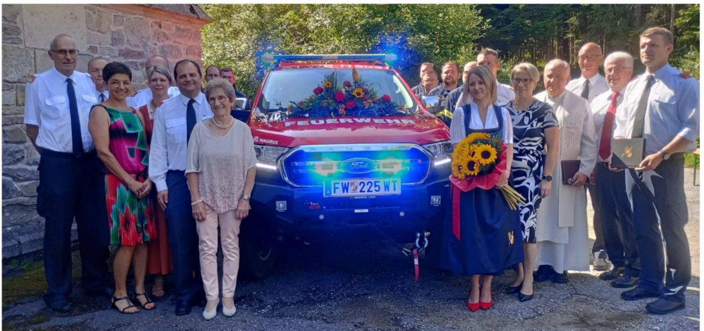
Die Ehrengäste samt Fahrzeugpatin der Fahrzeugsegnung, am 15. August 2024, bei der Bründlkapelle in Dietmanns